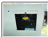
如使用比對式錢道夾幣位置