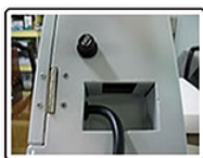
欲控制設備插頭進入孔