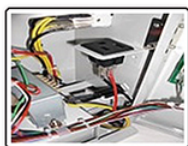
電器電源線插上此插座